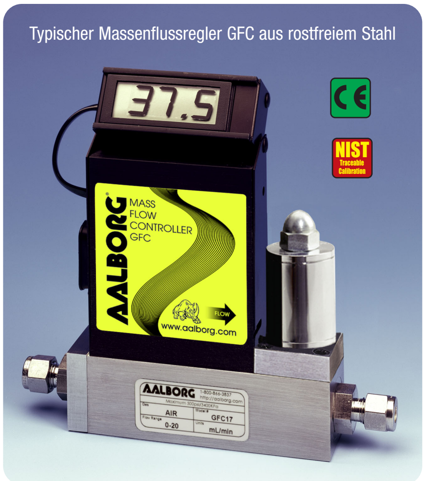
Typischer Massenflussregler GFC aus rostfreiem Stahl

Kompakte, unabhängige Massenflussregler GFC sind zur Anzeige und Überwachung von Gasdurchflussraten konzipiert. Die robuste Bauweise bietet in Verbindung mit einer den Instrumentierungen entsprechenden Genauigkeit eine vielseitige und wirtschaftliche Möglichkeit der Durchflussregelung. Modelle aus Aluminium oder edelstahl mit Anzeigen wahlweise entweder in technischen Maßeinheiten (Standard) oder in 0 bis 100 % sind lieferbar. Das eingebaute Elektromagnetventil gestattet eine Einstellung der Durchflussleistung auf jede gewünschte Durchflussrate innerhalb des für das jeweilige Modell vorgesehenen Bereichs. Das Ventil ist aus Sicherheitsgründen normalerweise geschlossen, um sicherzustellen, dass der Gasdurchfluss bei einem Stromausfall abgesperrt wird. Die Sollwerte werden entweder vor Ort oder als Fernfunktion geregelt und überwacht.